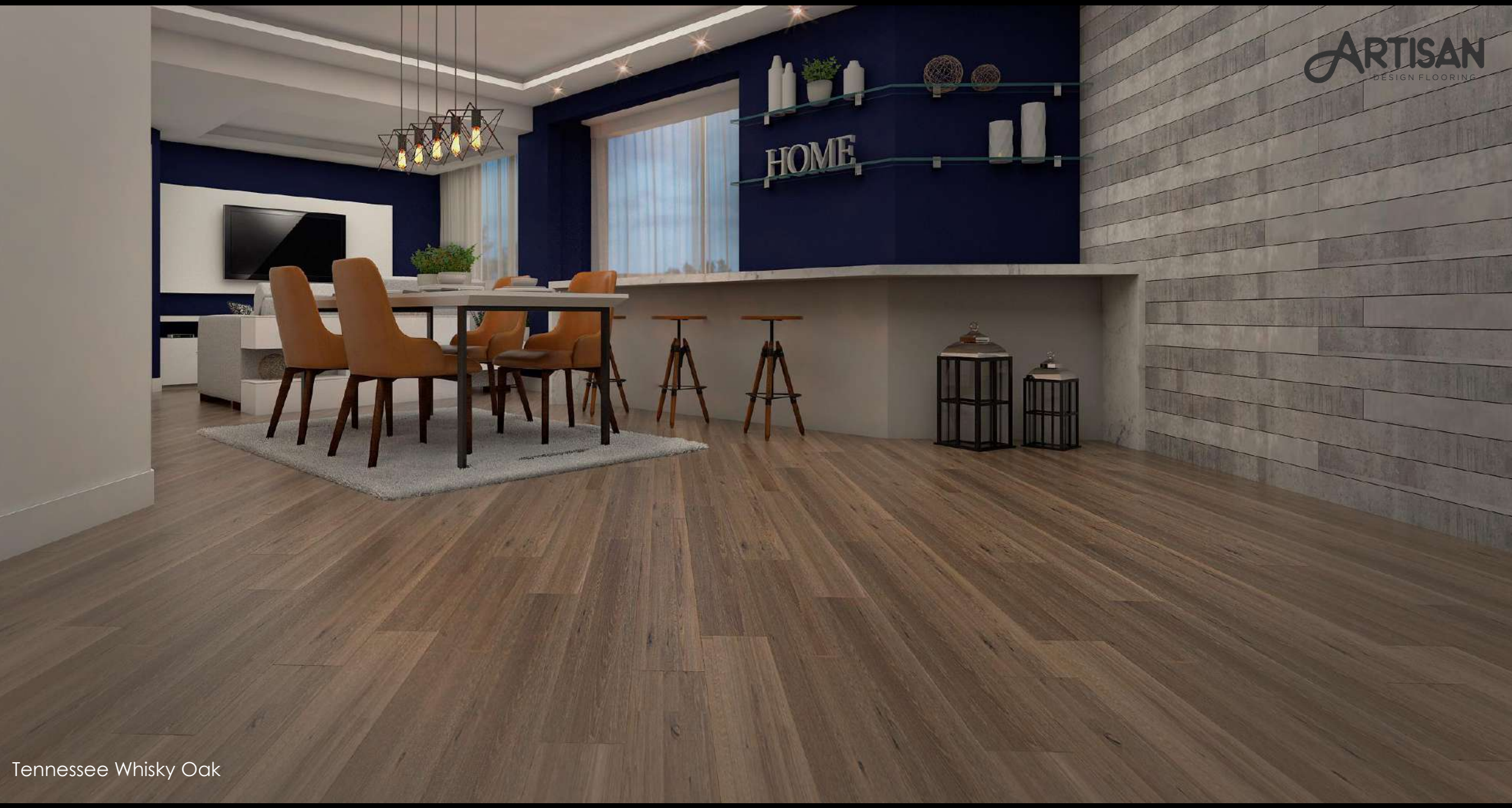
Tennessee Whisky Oak